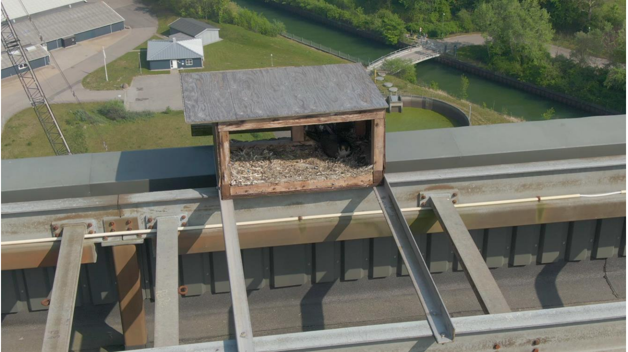
Vandrefalk på reden på Enstedværket få dage før sprængningen. 18. Maj 2019. Bagsiden af kassen var blæst væk samme vinter/forår.

Desuden er der opsat redekasser to steder i Sønderborg – ved Alsion og ved fjernvarmeværket ved byens nordlige udkant. Så vidt vides er der (endnu) ikke set vandrefalke ved disse kasser. I Haderslev er der for nylig opsat en kasse på toppen af bygningskomplekset ved Fuglsang. Men – som vi har set ved Enstedværket og andre steder - behøver et falkepar ikke nødvendigvis at bruge den opsatte redekasse. Måske kan de finde et andet egnet sted, som f.eks. en niche eller hul i noget murværk eller en hylde på større bygninger. I Østtyskland yngler arten også i gamle rovfuglereder.