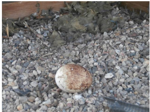
Enstedværket, 19. juli 2013