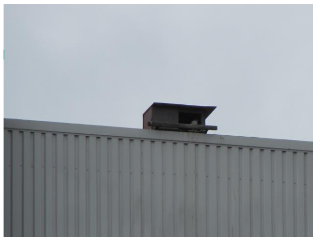
Vandrefalk, han. Juni 2018.