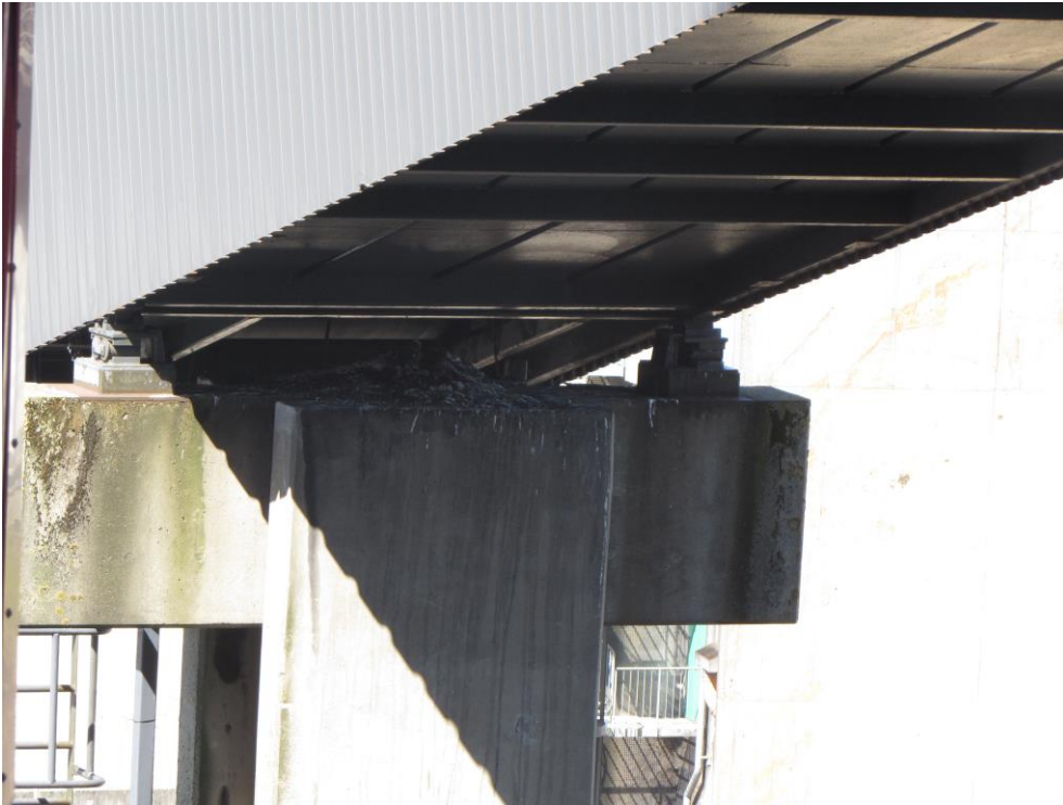
Rede i kulbunke på betonpille under transportbånd.

I 2016-19 ynglede vandrefalkeparret i redekassen – kun med succes i 2016-18, da reden med æg røg med, da værket ved en planlagt operation blev sprængt i luften i maj 2019! Begge voksne fugle undslap dog med livet i behold.