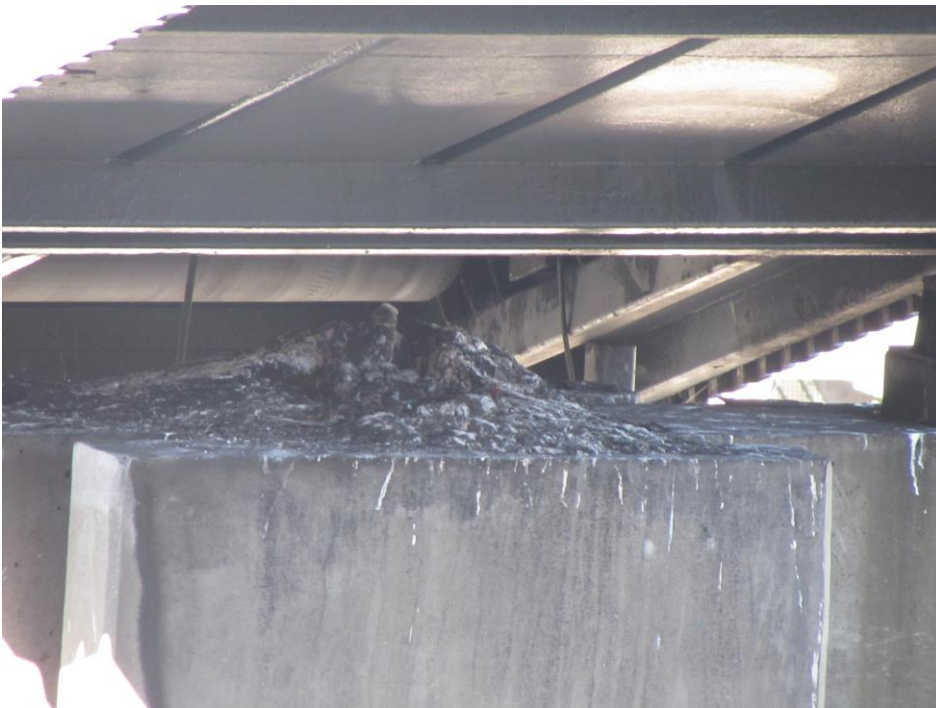
Reden med to unger.

I 2016-19 ynglede vandrefalkeparret i redekassen – kun med succes i 2016-18, da reden med æg røg med, da værket ved en planlagt operation blev sprængt i luften i maj 2019! Begge voksne fugle undslap dog med livet i behold.