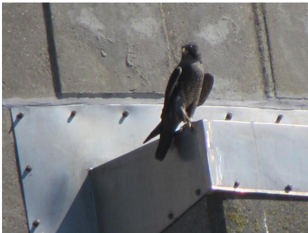
Vandrefalk, hun.

Efter flere besøg af enlige falke ved værket, blev den første unge set i sommeren 2013 – og dermed var vandrefalken for første gang i nyere tid at regne som sønderjysk ynglefugl! – Sammen et ynglefund ved Skærbækværket ved Fredericia, var det samtidig de første ynglefund i Jylland i mange år.