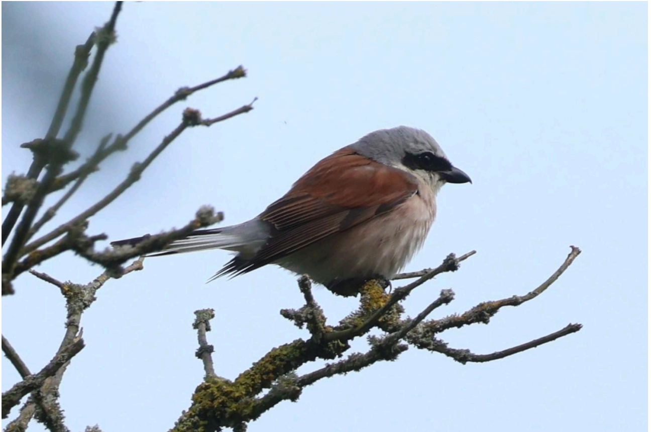
Figur 3 Rødrygget Tornskade, som allerede lever i Naturnationparken og det skal det blive ved med!.

Jeg har rejst spørgsmålet om forstyrrelse af fugle i naturnationalparkens bestyrelsen. Spørgsmålet er blot et at mange, som NNP-bestyrelsen skal finde svar på, og jeg er meget spændt på at se hvordan det kommer til at forløbe og hvor vi ender.