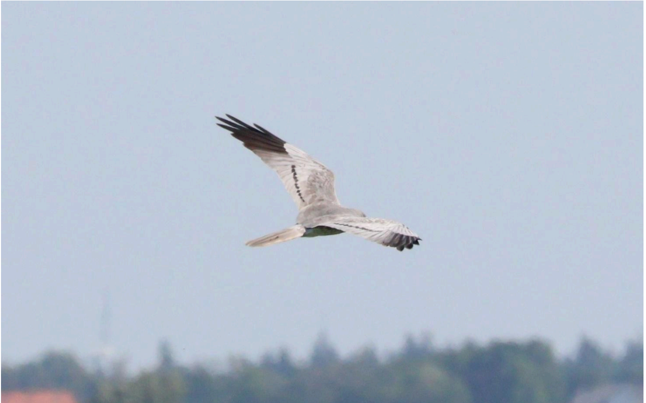
Figur 2 Hedehøg på udpegningsgrundlaget for EU fuglebeskyttelsesområde Draved Skov og Kongens Mose, skal nyde streng beskyttelse i Naturnationalparken.

Jeg er i dialog med DOFs naturpolitiske udvalg og med DOFs repræsentanter i de andre naturnationalparker om netop forstyrrelserne af fuglene. Jeg oplever, at forstyrrelser i naturnationalparkerne er et emne, som bekymrer mange ornitologer.