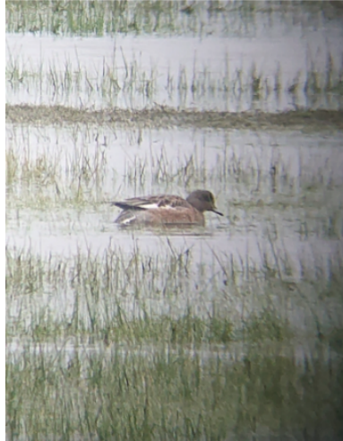
Amerikansk pibeand. Margrethe Kog den 26. april.