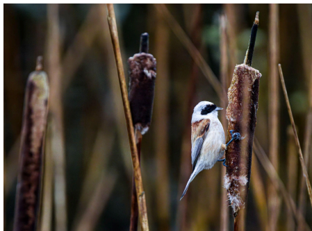
Pungmejse, Sølsted Mose den 2. april.

Mindre kan gøre det, og dejligt er det, at der er set hvidbrystet præstekrave, stylteløber, gulirisk, odinshane, pungmejse, rødhalset gås, savisanger, sort glente og steppehøg.