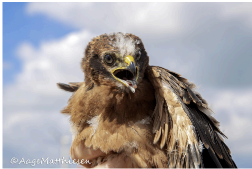
Hedehøg, juvenil.