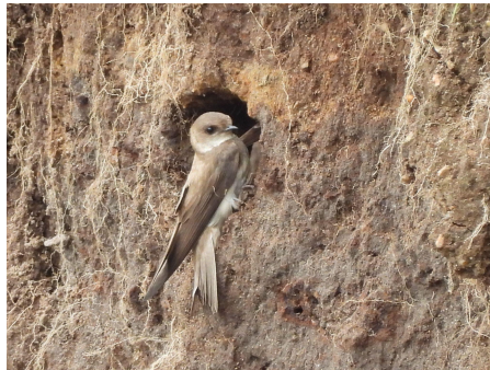
Digesvale ved redehul.

Tællerne har gjort et kæmpestort og flot stykke arbejde!