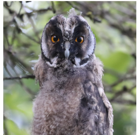
Unge af skovhornugle.

Anden del af Chris Seatons fortælling om ynglende skovhornugler kan nu læses på hjemmesiden.