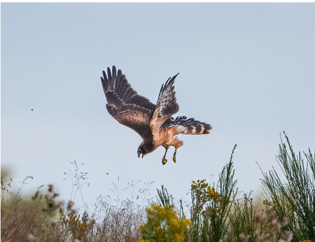
En af årets unger der træner flyvefærdigheder.

Årets eneste sikre ynglepar nord for Kongeåen, gik grueligt meget igennem, men endte med at få to unger på vingerne. Det drejer sig om parret ved Nørbølling, Brørup. I sidste måneds nyhedsbrev skrev vi om, hvordan reden nærmest blev ødelagt af et skybrud. Alligevel klækkede tre af æggene og to unger nåede at blive flyvefærdige. Dette kuld blev, sammen med et kuld fra Fole, årets seneste. Begge steder var ungerne først flyvefærdige midt i august. Det har med stor sandsynlighed drejet sig om par, der har lagt om, efter at første yngleforsøg er gået tabt.