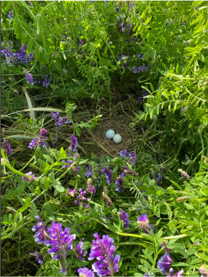
Rede i fodervikke nær Brørup.

I år er der kun fundet en rede, som ikke er anlagt i den dyrket mark. Denne rede er placeret kun 7 meter fra en sti, hvor der dagligt kommer gående og cyklister – så en meget speciel placering. Eller er rederne placeret i vinterbyg, rug, hvede og græsmarker. Desuden kan der i år føjes en ny afgrøde til – nemlig fodervikke.